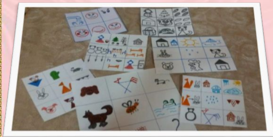
Схема составления рассказа (Ефименкова Л.Н)