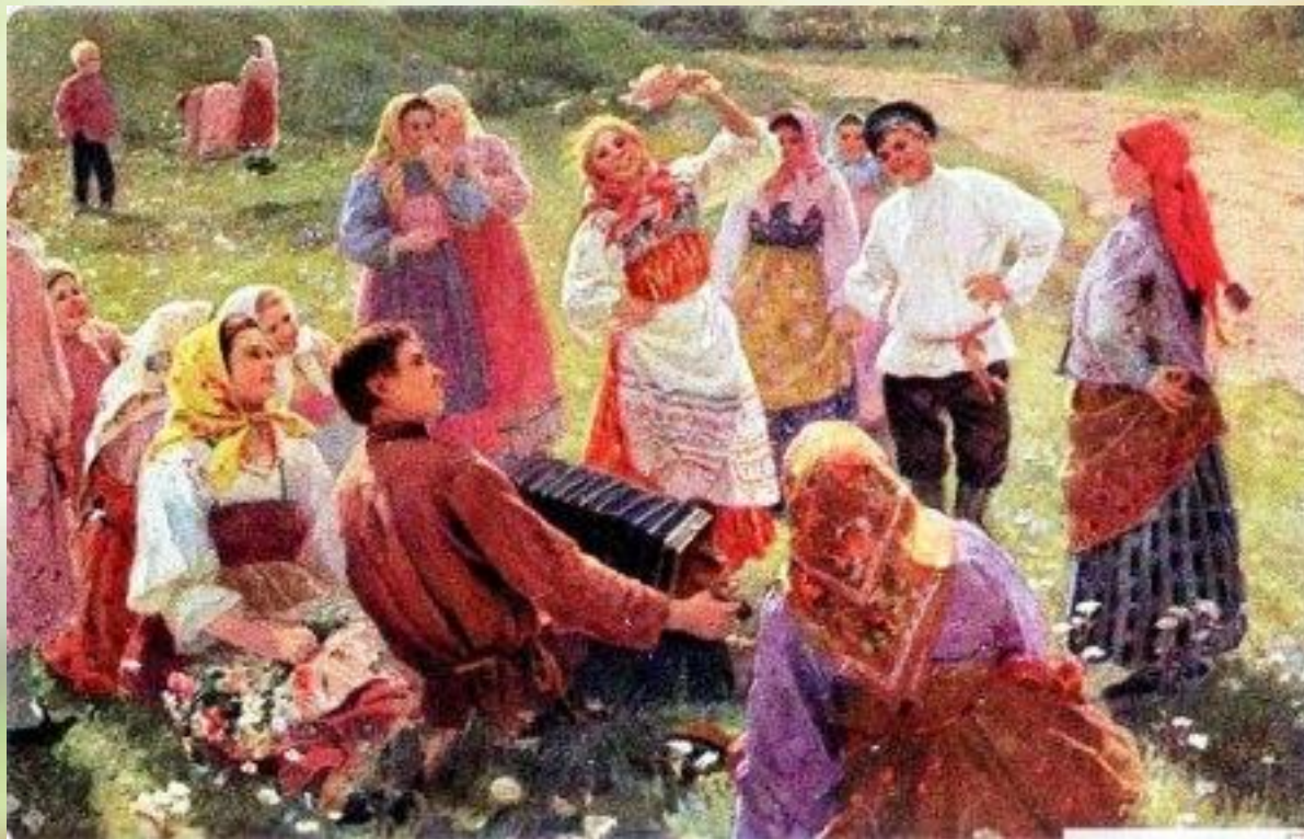
Сычков Федор Васильевич . Танец.

Хороши русские летние праздники! Лето на Руси — пора со множеством забот. Но есть в эту хлопотливую, трудовую пору праздничные дни. И каждый праздник хорош по-своему! Один из главных - праздник Святой Троицы. Говорят: "На Троицу земля – именинница" . В этот день землю не пашут, не копают, отдыхает земля-матушка.