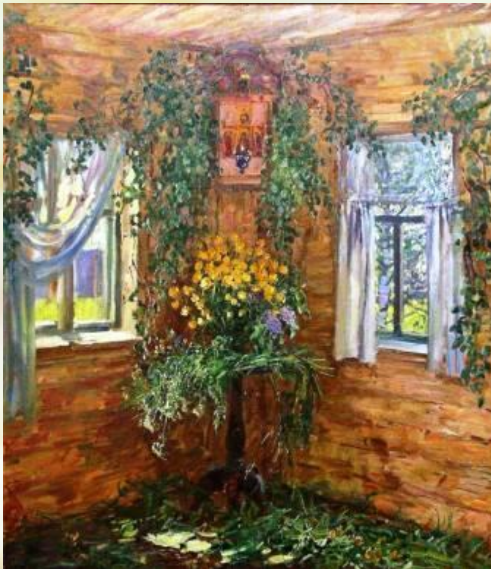
М.Абакумов «На Троицу»

На Троицу куда ни глянь – везде зелено, даже на полу скошенная трава лежит. Поэтому и пахнет в этот день в домах зеленью, будто в лесу или на лугу во время сенокоса. У людей в руках тоже березовые ветки. Несут эти ветки домой, ставят их в Красный угол на целый год, до следующей Троицы.