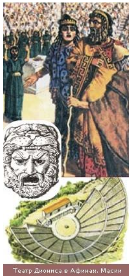
Театр Диониса в Афинах. Маски