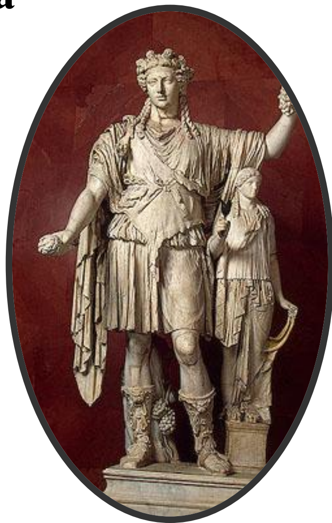
Скульптура бога Диониса

Вскоре праздники были перенесены в специальные места - театры , а спустя некоторое время появились драматурги - люди сочинявшие пьесы для театра.