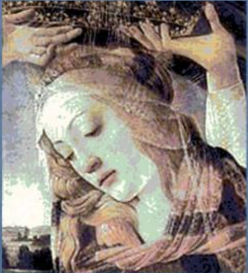
Сандро Боттичелли. Голова Мадонны. Фрагмент.

БОТТИЧЕЛЛИ (Botticelli) Сандро (наст. Алессандро Филипепи, Filiperi) (1445-1510), итальянский живописец. Представитель Раннего Возрождения. Был близок ко двору Медичи и гуманистическим кругам Флоренции.