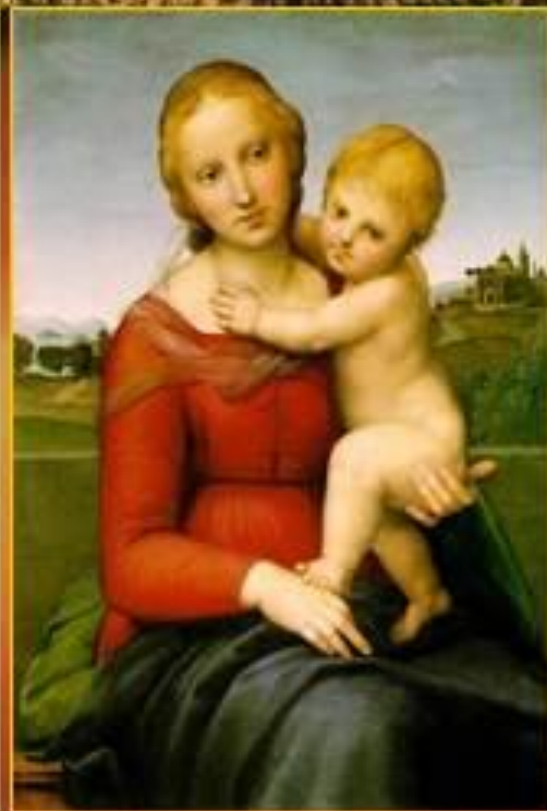
Малая Мадонна Каупера