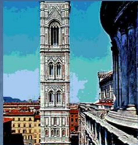
Кампанила собора Санта-Мария дель Фьоре во Флоренции. Построена в 1334-1359 гг.

ДЖОТТО ди Бондоне (Giotto di Bondone) (1266/1267, Колле да Веспиньяно, Тоскана — 8 января 1337, Флоренция), итальянский живописец, мастер флорентийской школы. Имя художника, видимо, является производным от Амброджотто (Амброджо) или Андзолотто (Анджело).