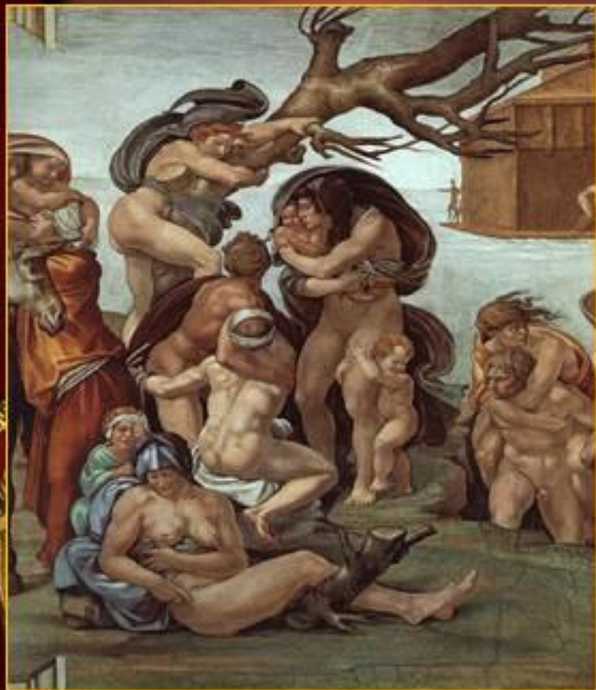
Сикстинская капелла «Потоп»