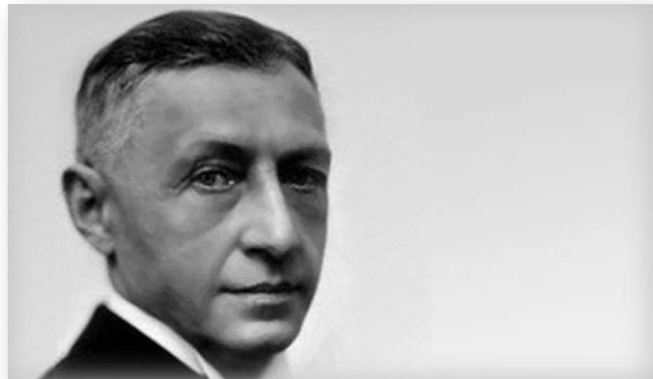
Бунин Иван Алексеевич

Это поистине редкая книга: какая свобода, какая чудесная удаль, какая меткость, точность во всем и какой необыкновенный народный солдатский язык — ни сучка ни задоринки, ни единого фальшивого, готового, то есть литературно-пошлого слова!