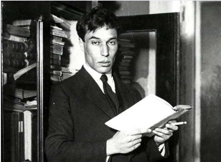
Солженицын Александр Исаевич