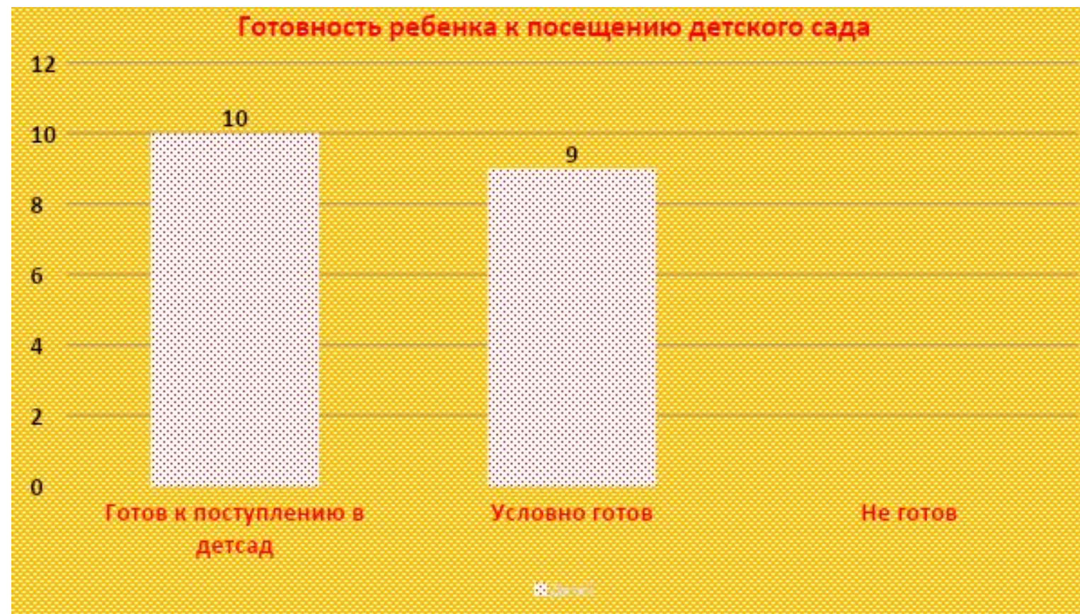
ДИАГРАММА ГОТОВНОСТИ РЕБЕНКА К ДЕТСКОМУ САДУ