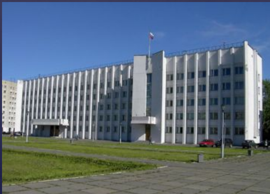
Здание мэрии Архангельска