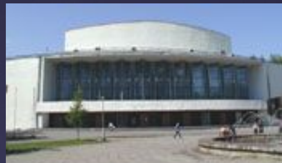
Театр драмы им. М.В. Ломоносова