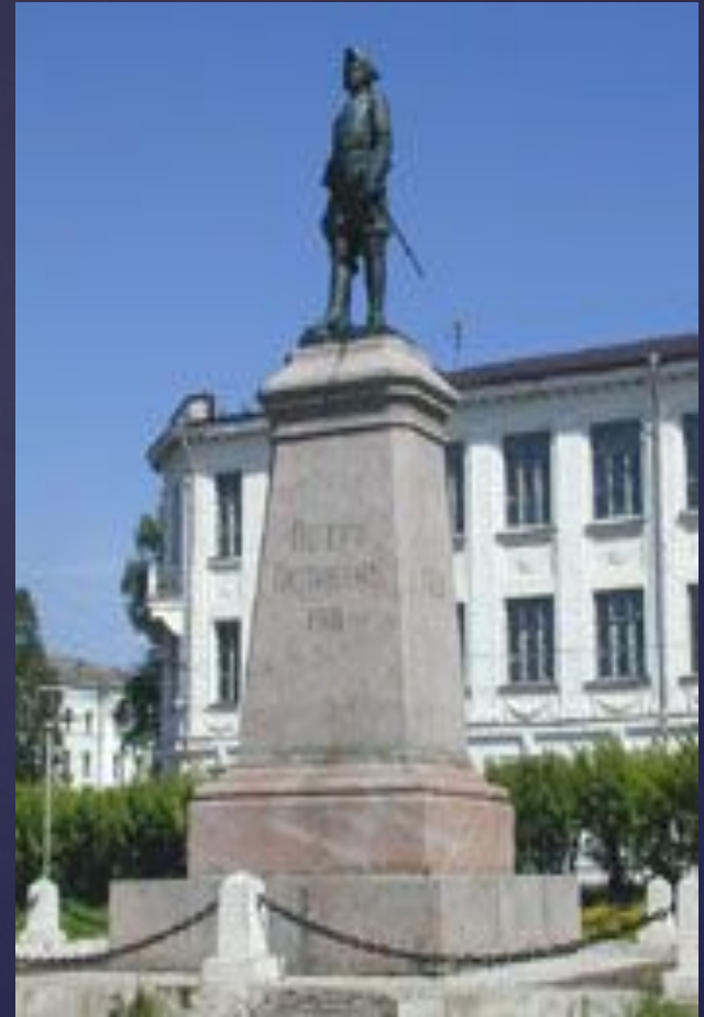
Памятник Петру I

Агрессия Швеции на просторах Белого моря привела Петра I к решению о необходимости фортификационных сооружений в городе. По царскому приказу здесь в 1701 году началось строительство Новодвинской крепости, под стенами которой 25-26 июня 1701 года произошло знаменитое победоносное для русских Новодвинское сражение.