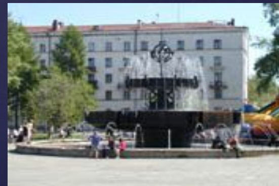
Фонтан у Драмтеатра