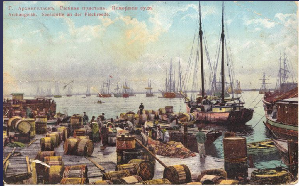
Г. Архангельск. Рыбная пристань. Поморскія суда. Archangelsk. Seeschiffe an der Fischreede.

В 1584-1585 гг. по приказу Ивана Грозного вокруг монастыря была возведена деревянная крепость, которая своим величием поражала прибывающих в эту местность иностранцев. Несколько десятилетий менялось название крепости - Новый город, Новый Холмогорский город, Новохолмогоры, Архангельский город и лишь с годами город стали называть Архангельском.