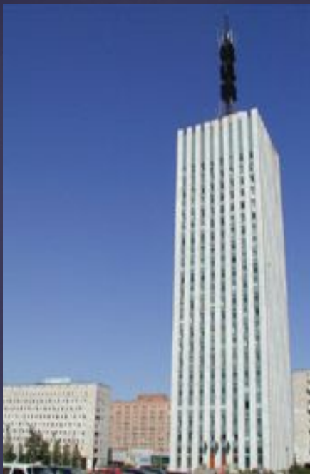
"Высотка" на пл.Ленина