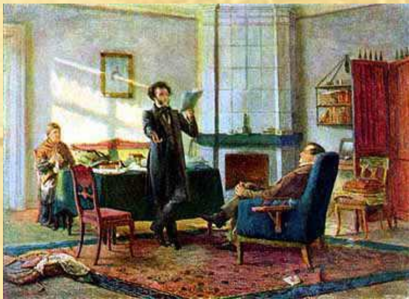
Пушкин в селе Михайловском (Пушкин у Пушкина). Н.Н. Ге. 1875 г.

В некоторых стихах Александр Пушкин высмеивал власти. Из-за этого его отправили в ссылку на юг, в Кишенёв.