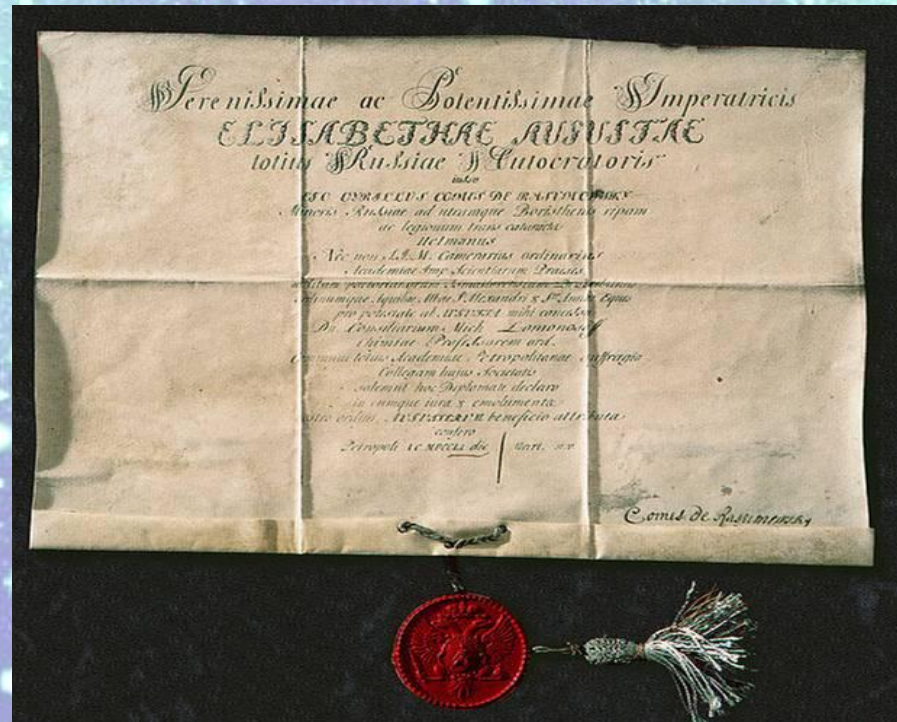
Диплом профессора химии