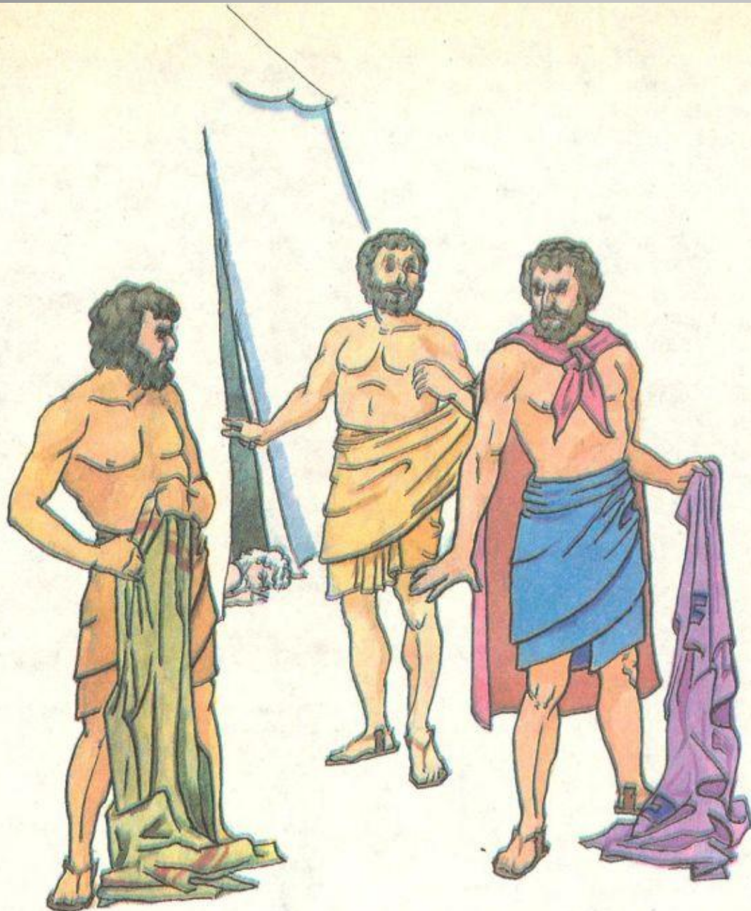
Сим, Хам и Иафет

Из текстов Священного Писания можно сделать вывод, что не все сыновья Ноя были подобны своему отцу. Библия кратко говорит о непочтительности Хама к своему отцу и косвенно указывает на тяжкий грех, совершенный Ханааном (сыном Хама). Уже эти обстоятельства показывают, что часть людей не извлекли уроки из произошедшей всемирной катастрофы, но продолжили путь противления Богу.