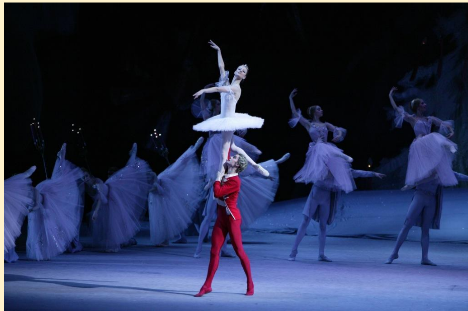
П.И. Чайковский балет «Щелкунчик»

Даже опера и балет обрели на экране как бы второе рождение. Для телеоперы, телебалета многие композиторы специально пишут музыку.