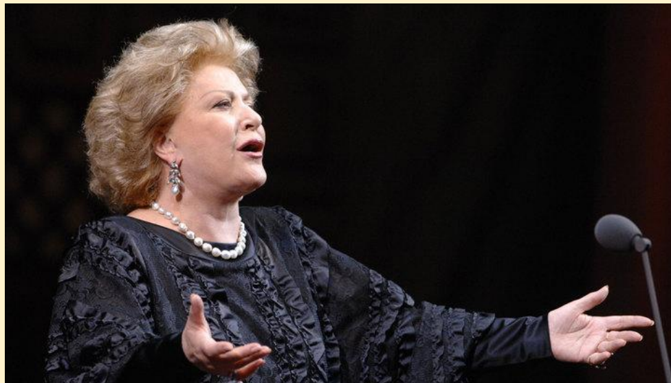
Е. В. Образцова