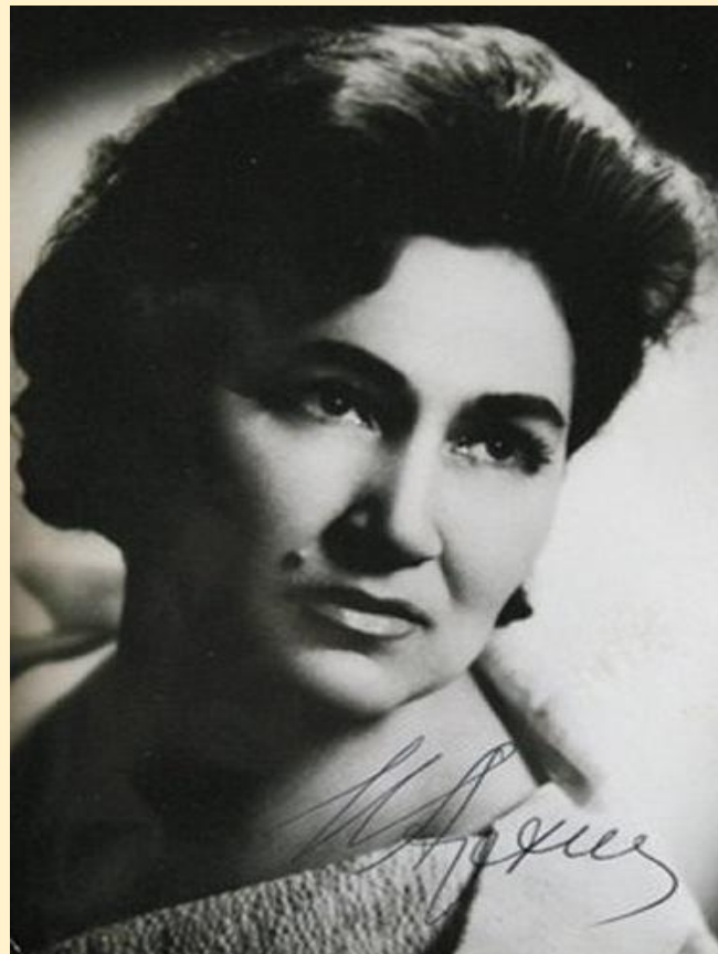
И. К. Архипова