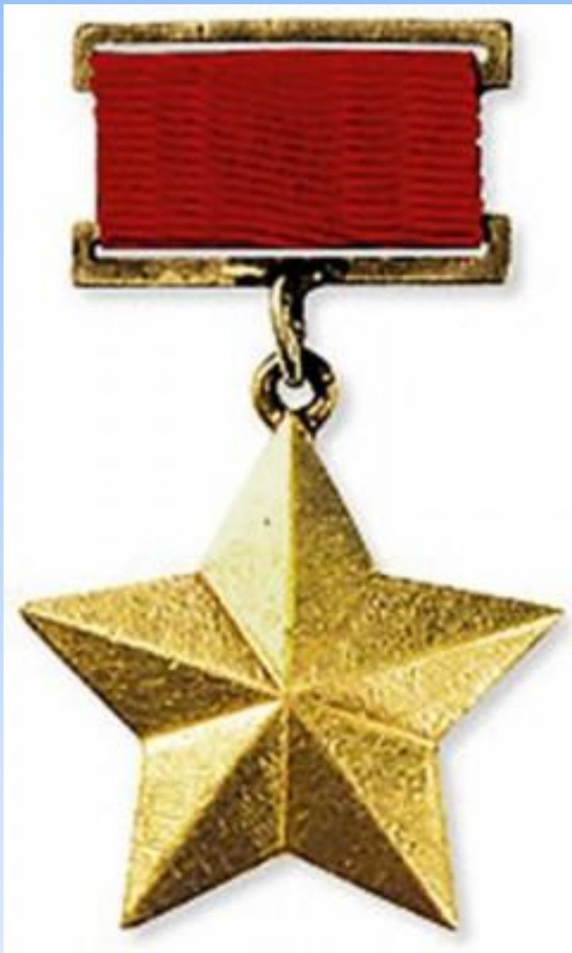
Медаль города -Героя