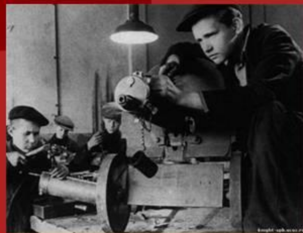
Работали на военных заводах