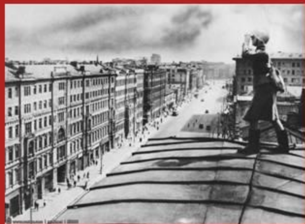
Дежурили на крышах