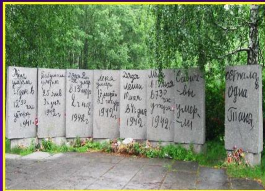
Памятник семье Савичевых

Таня Савичева жила в ленинградской семье. Началась война, затем блокада.