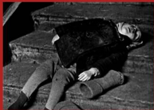
Умирали от голода и холода