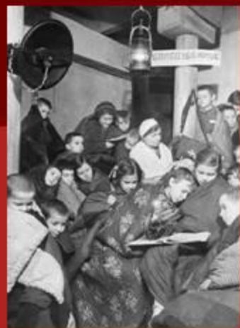
Скрывались от бомбёжек