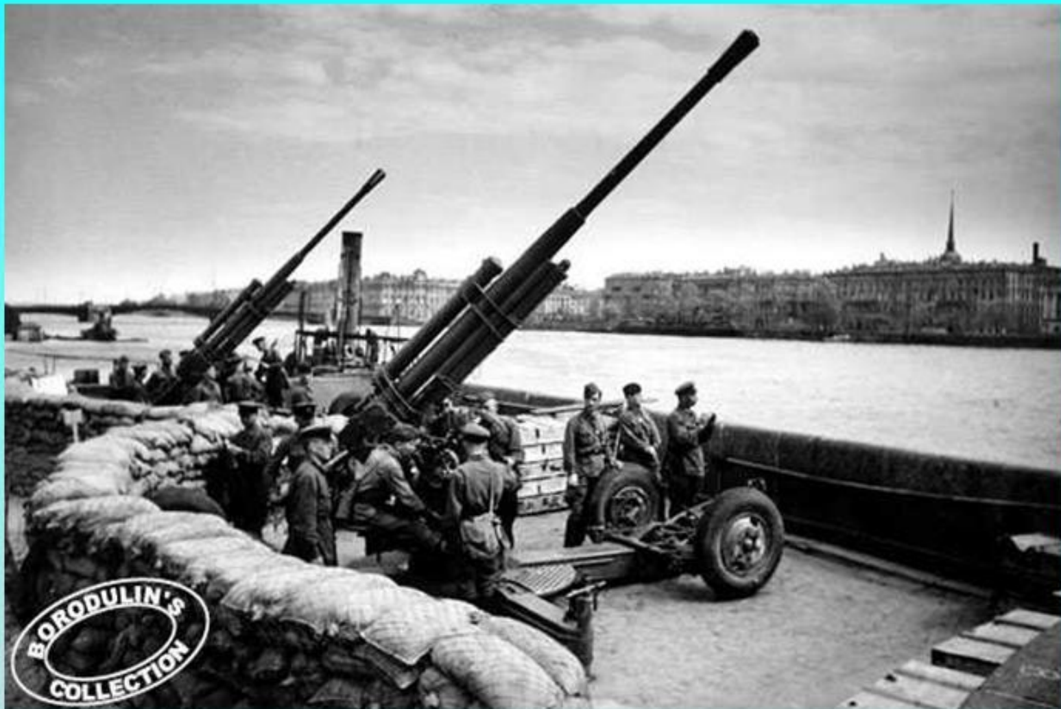
На берегу Невы.