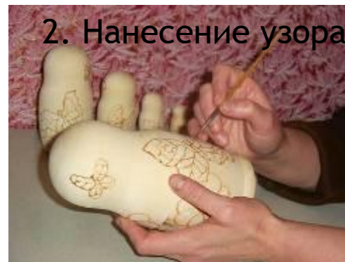
2. Нанесение узора