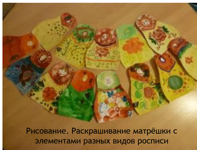
Рисование. Раскрашивание матрёшки с элементами разных видов росписи