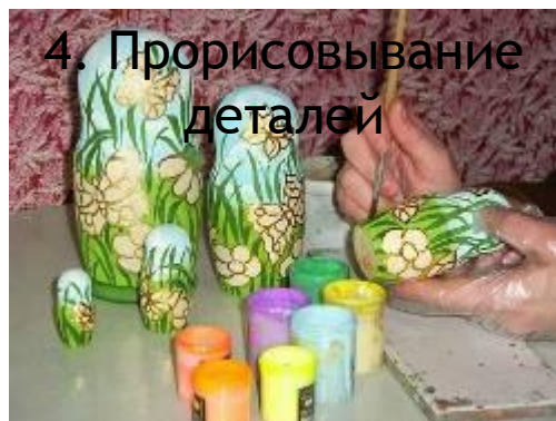
4. Прорисовывание деталей