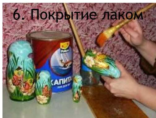
6. Покрытие лаком

В девятнадцатом веке для росписи этих игрушек использовали гуашь - теперь же уникальные образы матрёшек создаются также с помощью анилиновых красок, темперы, акварели. Но гуашь всё равно остаётся любимой краской художников, расписывающих матрёшек. Первым делом разрисовывается лицо игрушки и передник с живописным изображением, и уже потом - сарафан и косынка.