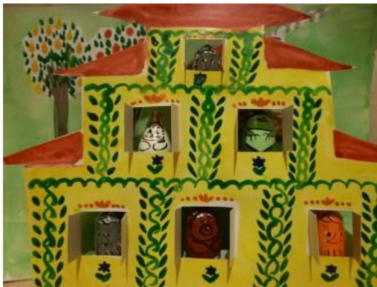
Комплекс видов деятельности. Изготовление декораций для пальчикового театра «Теремок»