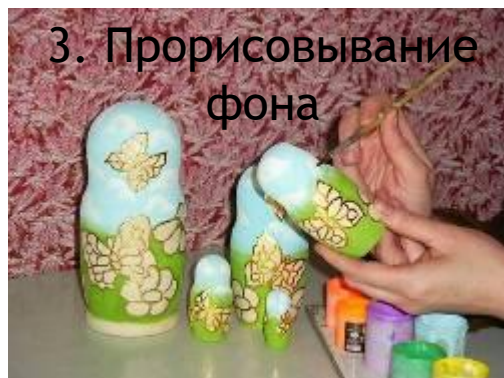
3. Прорисовывание фона