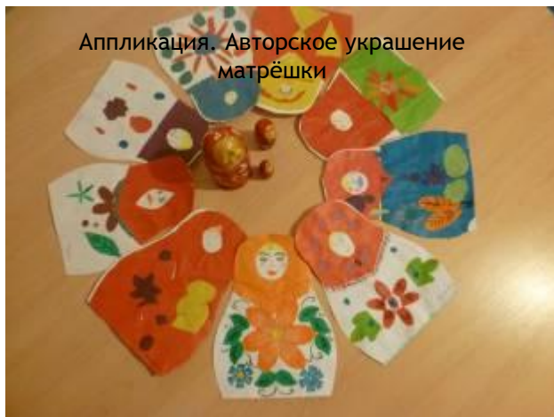
Аппликация. Авторское украшение матрёшки