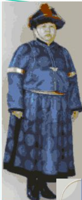
(Пример шёлков халата)