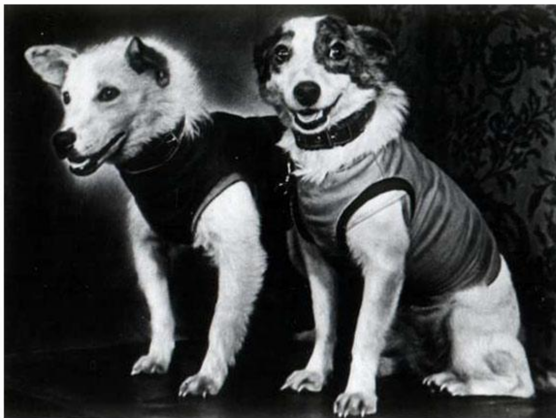
БЕЛКА И СТРЕЛКА

В 1958 году увеличили размер ракеты и отправили две собаки-лайки: Белку и Стрелку.