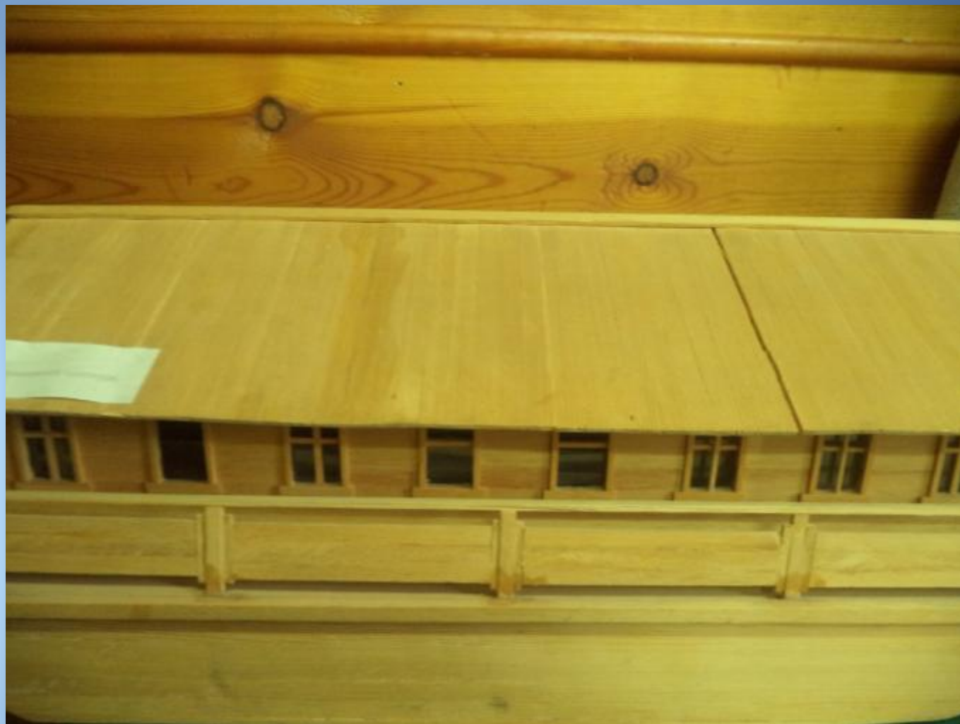
Брандвахта модель судна Шумиловской судовой верфи 1940-е гг.

Колхозы, занимающиеся рыбной ловлей, сдавали государству рыбу: 1198 ц стерляди и осетра, 860 ц тайменя, ленка, сига и хариуса, 7 тыс. ц щуки, плотвы, ельца, окуня.