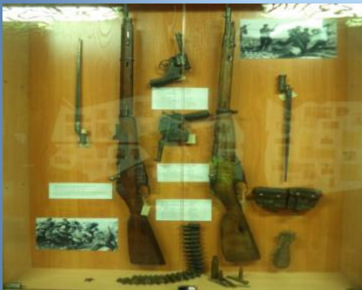
Оружие, с которым воевали наши деды.