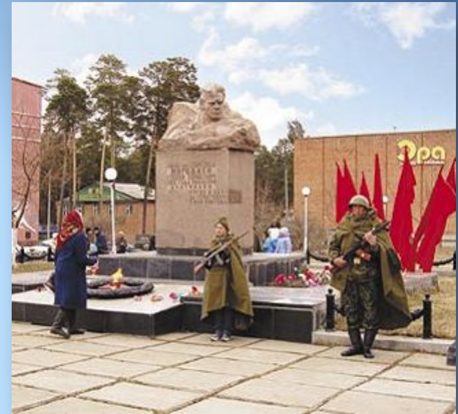
Памятник герою в пос. Энергетик

Он перед нами вновь предстал! Скульптурой Кошкина в граните он вознесен на пьедестал!