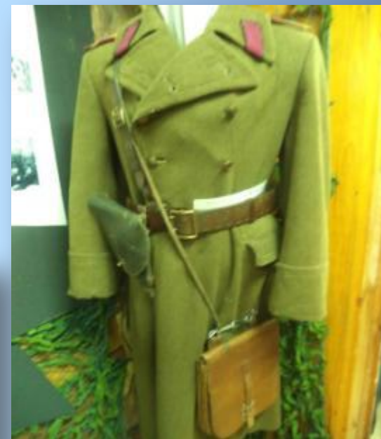
Фронтальная шинель командира .