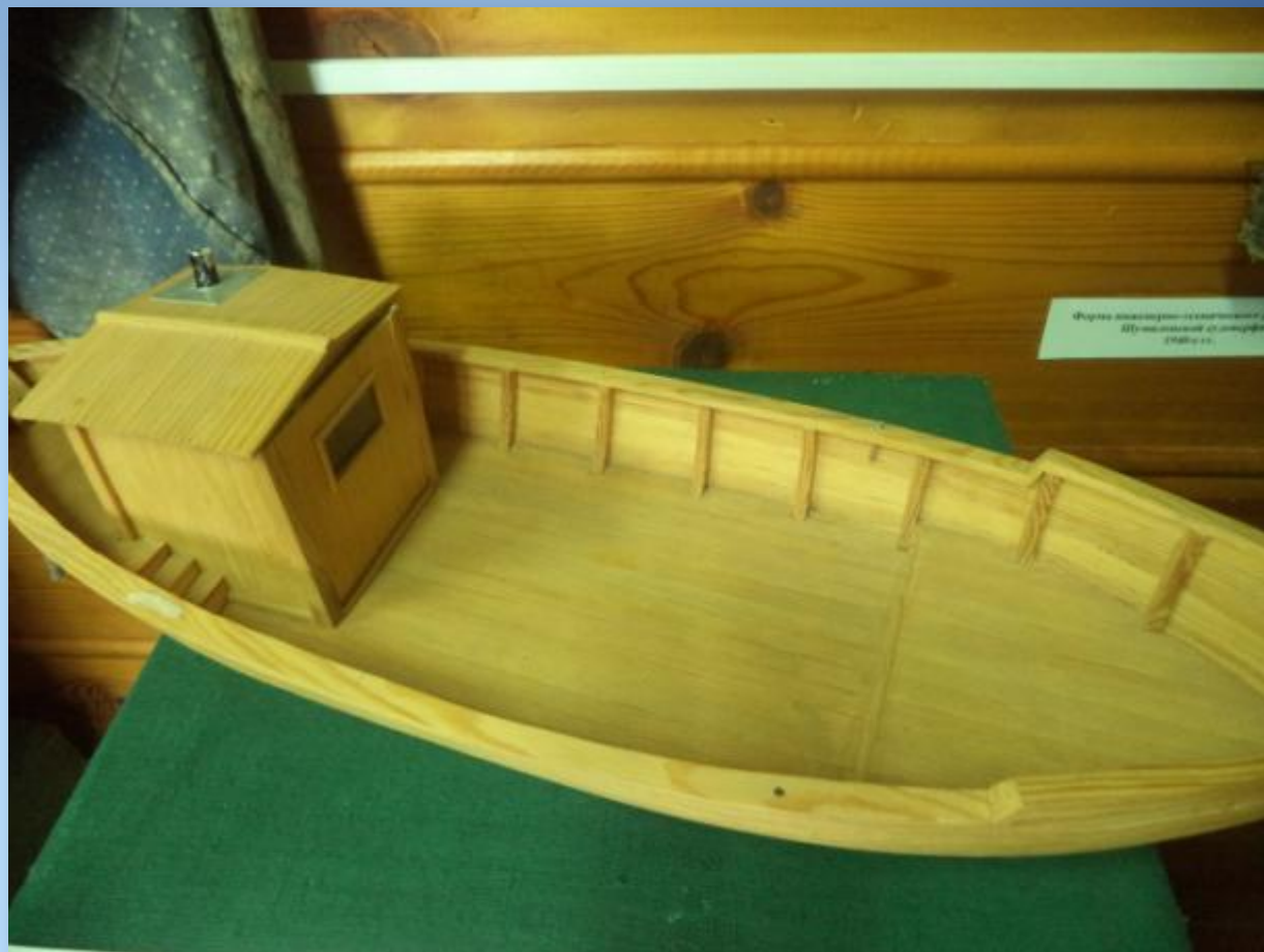
Карбаз модель судна Шумиловской судовой верфи.

На этом судне по Ангаре доставляли продукты до Иркутска, а дальше поездом на фронт.