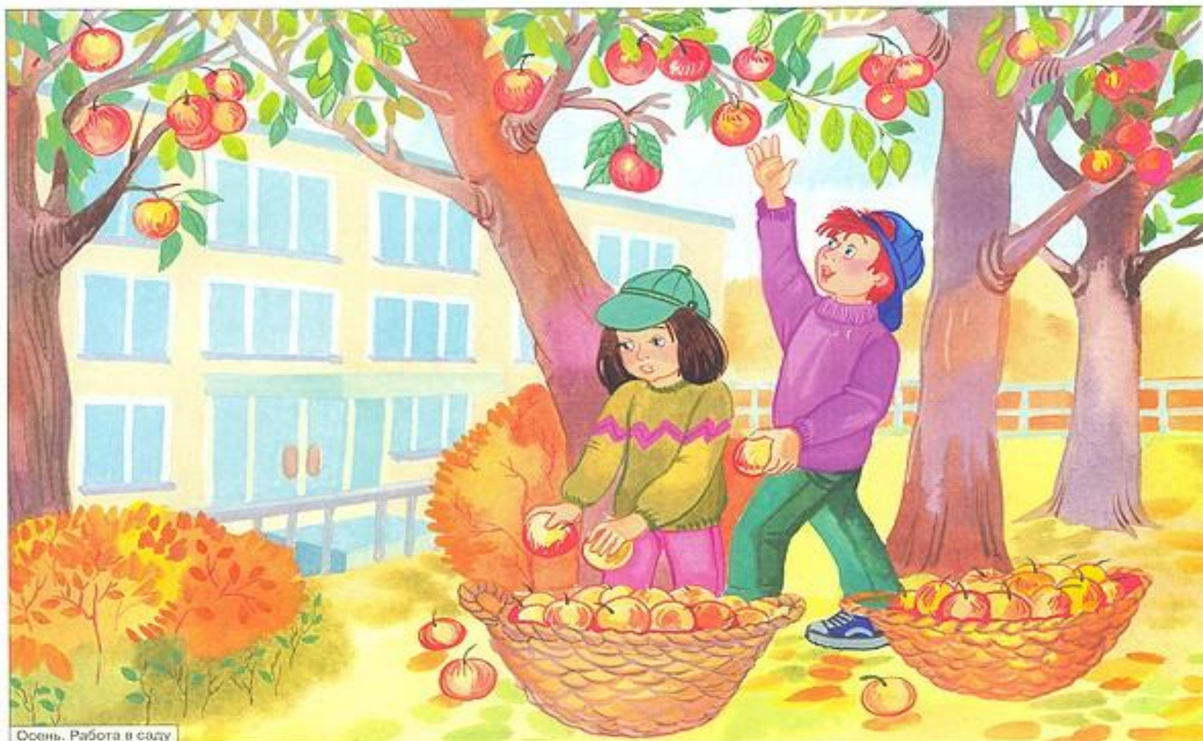
Осень. Работа в саду