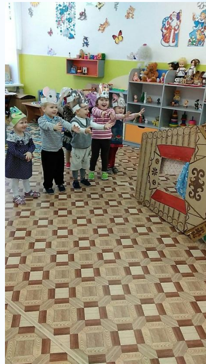
Инсценировка сказки «Теремок»