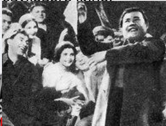
Первый звуковой фильм в России «Путевка в жизнь»

«Чапаев» — советский художественный фильм 1934 года. На I Московском кинофестивале 1935 года создатели «Чапаева»