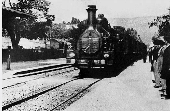
Кадр из фильма «Прибытие поезда на вокзал Ла - Съота»

В 1894 г французы братья Люмьер – Огюст и Луи услышали о кинетоскопе. Этот прибор представляющий собой ящик с движущимися фото, создал Томас Эдисон. Зритель глядя, в кинетоскоп видел движение различных предметов. Братья построили свой собственный прибор – «кинематограф», который проецировал изображение на экран. В 1895 году братья Люмьер показали первый фильм «Прибытие поезда», который длился менее 1 минуты.