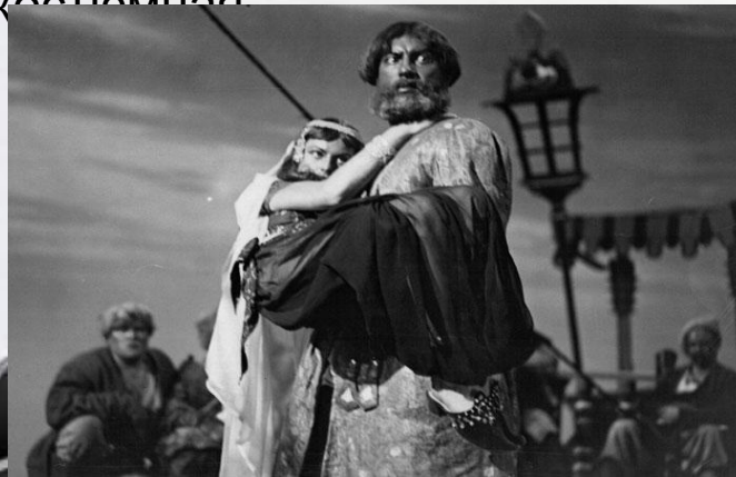
Первый немой русский фильм «Степан Разин»

В 1908 году режиссер и Александр Дранков поставил первый русский художественный фильм с актерами под названием «Понизовая вольница» («Степан Разин»). Картина была черно-белая, немая, короткометражная, костюмная.