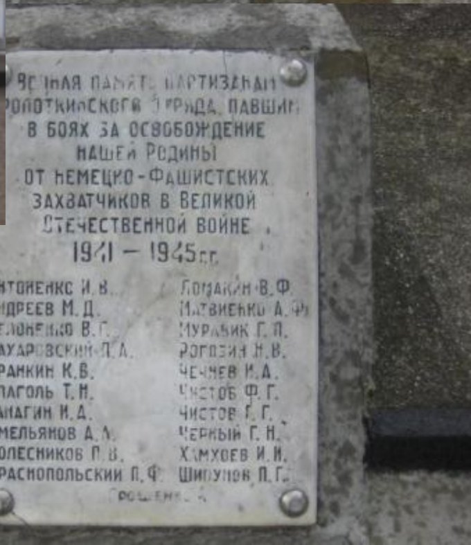
Партизанам кропоткинского отряда