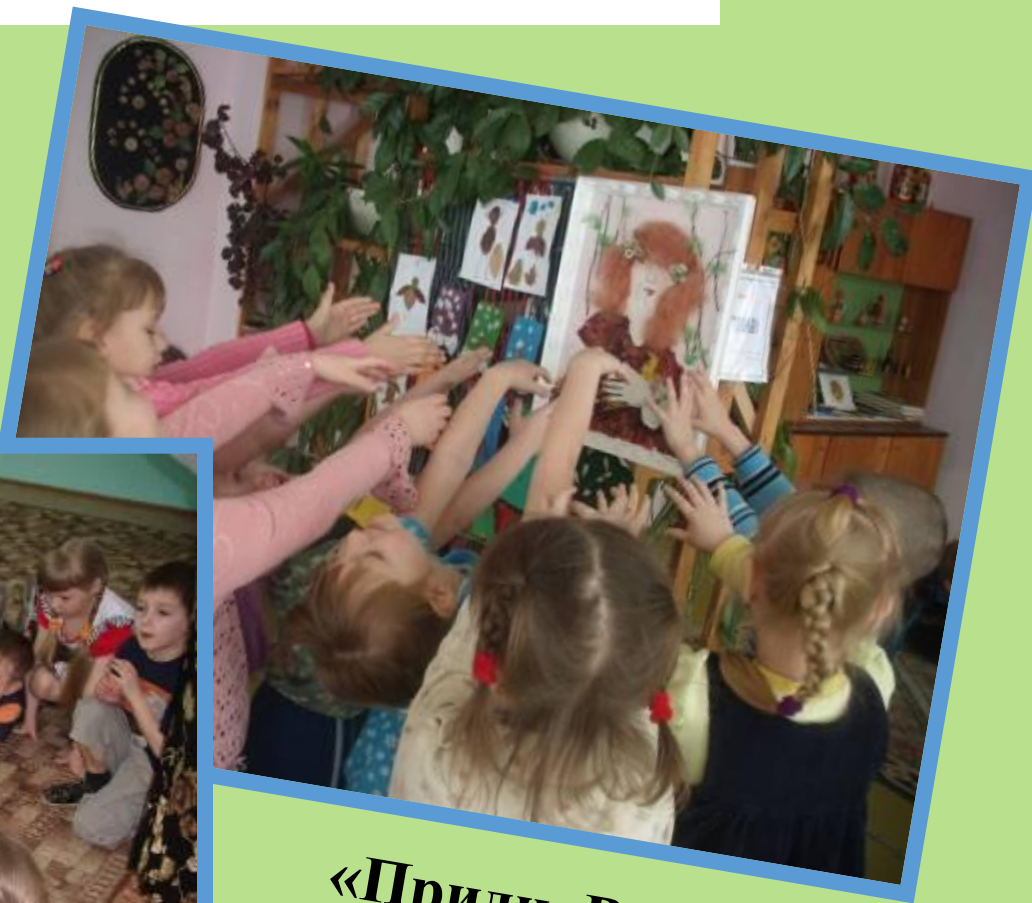
«Приди, Весна- красна»