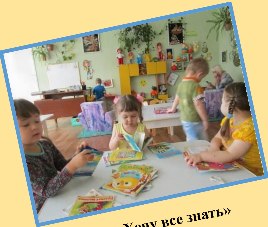
«Хочу все знать»