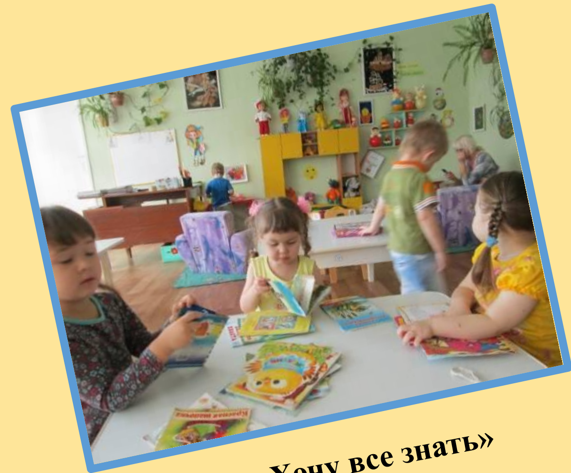
«Хочу все знать»