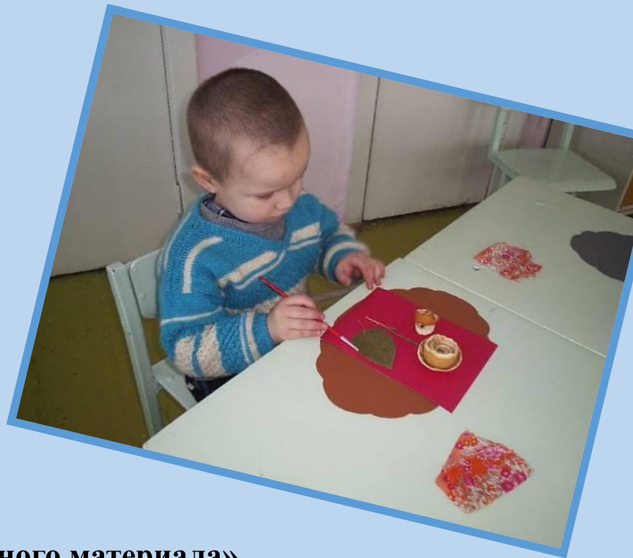
«Чудеса из природного материала»