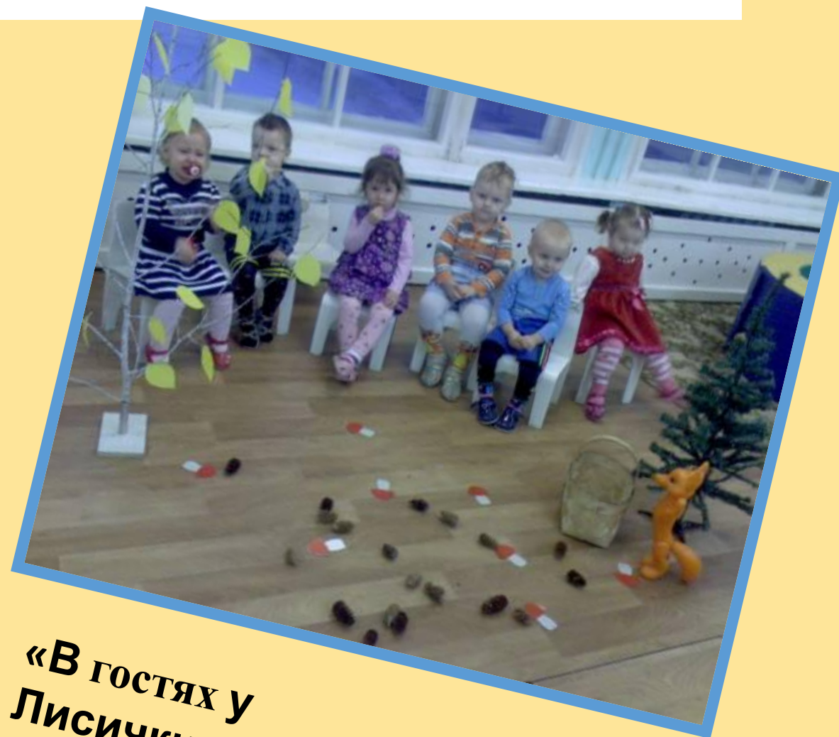
«В гостях у Лисички»