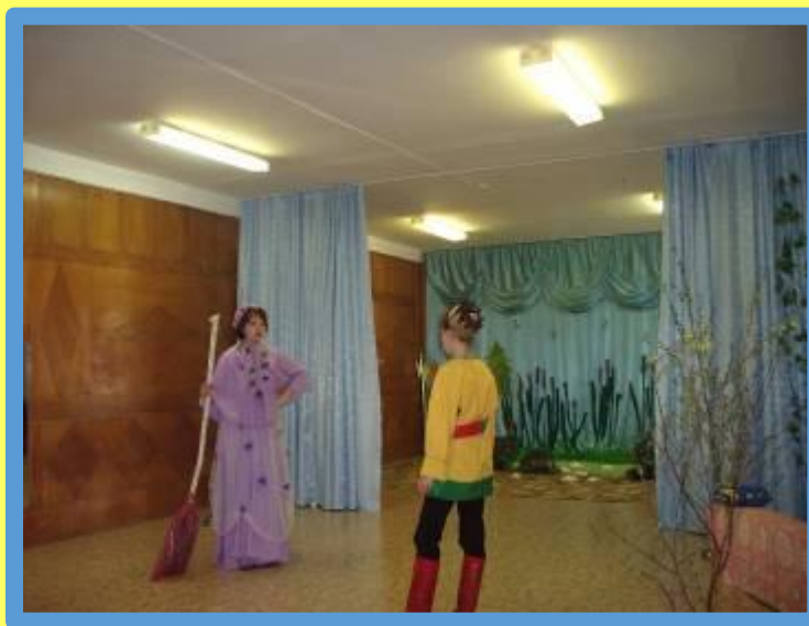
«Царевна – лягушка»