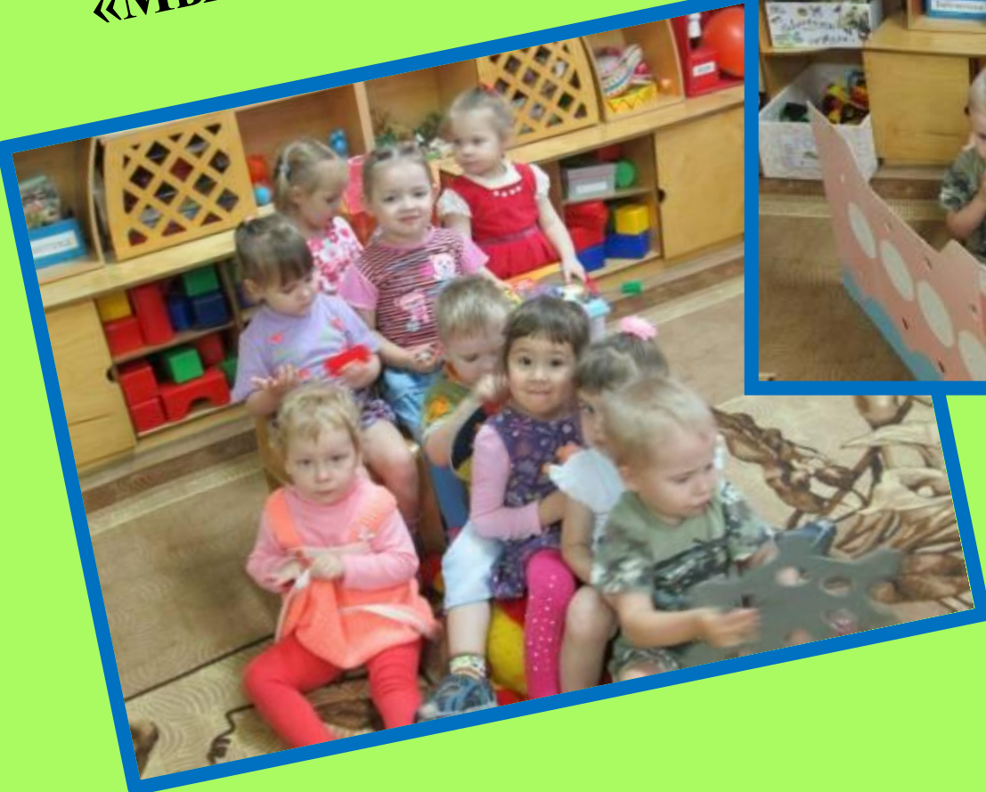
«Мы – капитаны»