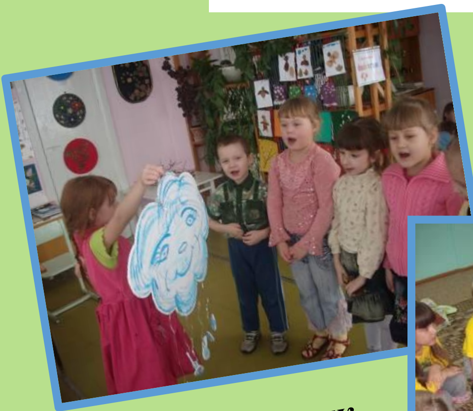
«Дождик, дождик, поливай»