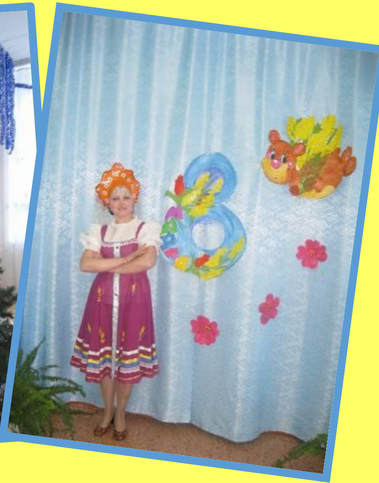
«Участие в утренниках и мероприятиях детского сада»