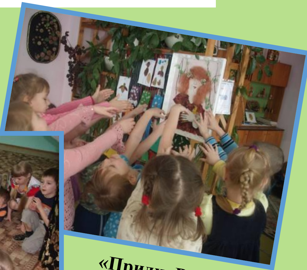
«Приди, Весна- красна»