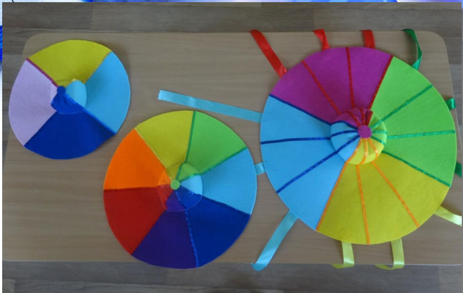
Дидактическое пособие «Модель времени»