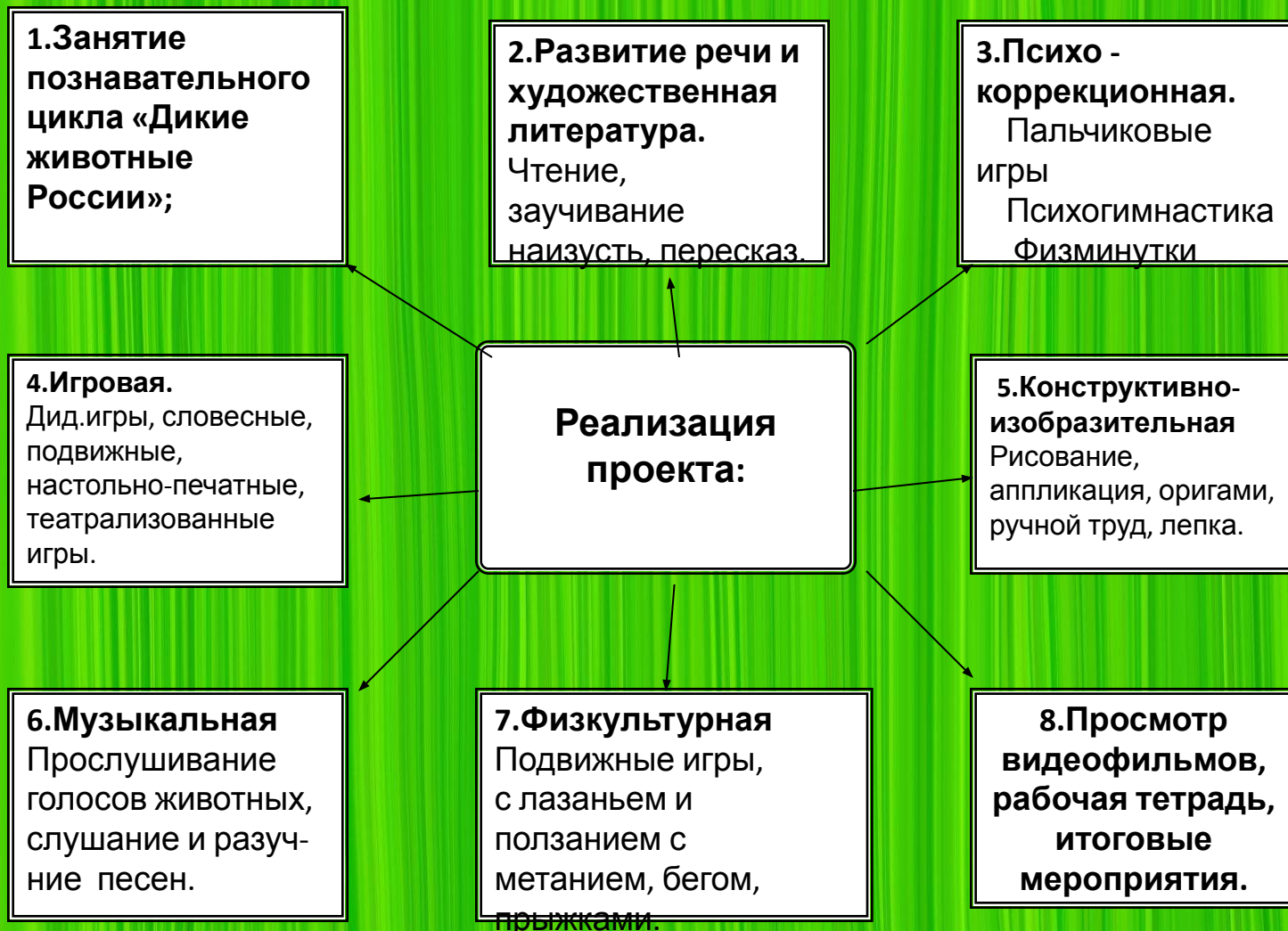
Схема реализации проекта через виды деятельности Схема-модуль