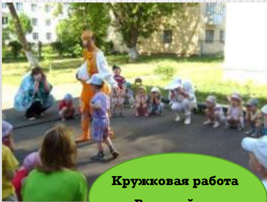
Кружковая работа «Веселый мяч»