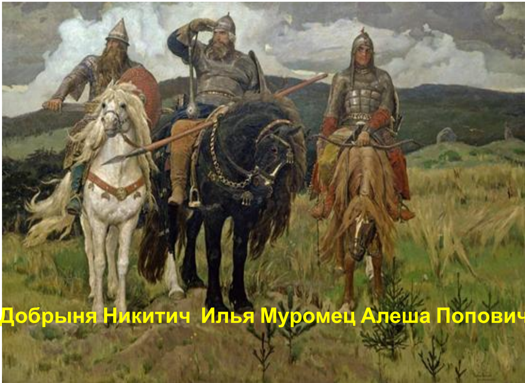
Добрыня Никитич Илья Муромец Алеша Попович