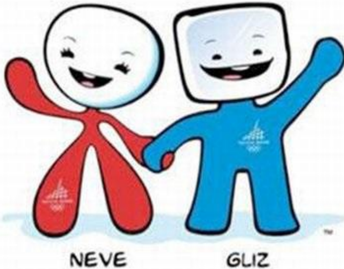
Девочка- снежок Неве и кубик льда Глиц