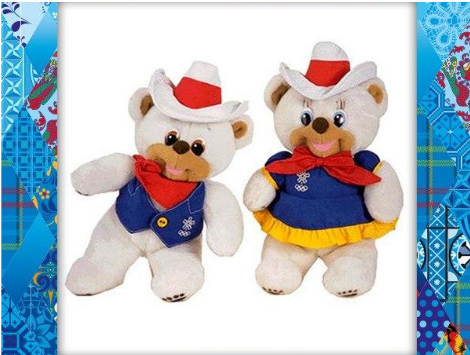
Полярные медведи: Хайди и Хоуди