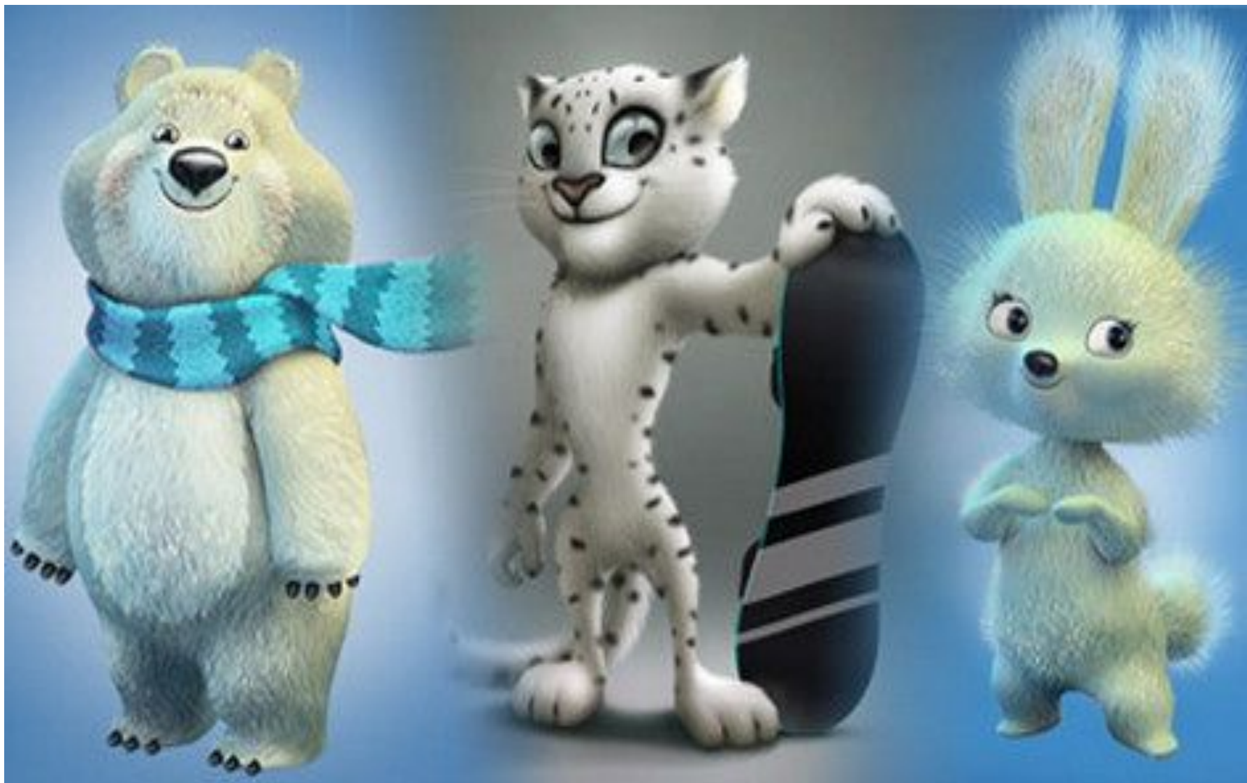
Белый медведь, Леопард и Зайка