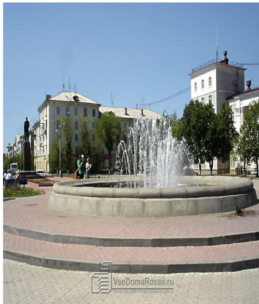
ФОНТАН НА ПЛОЩАДИ ЛЕНИНА