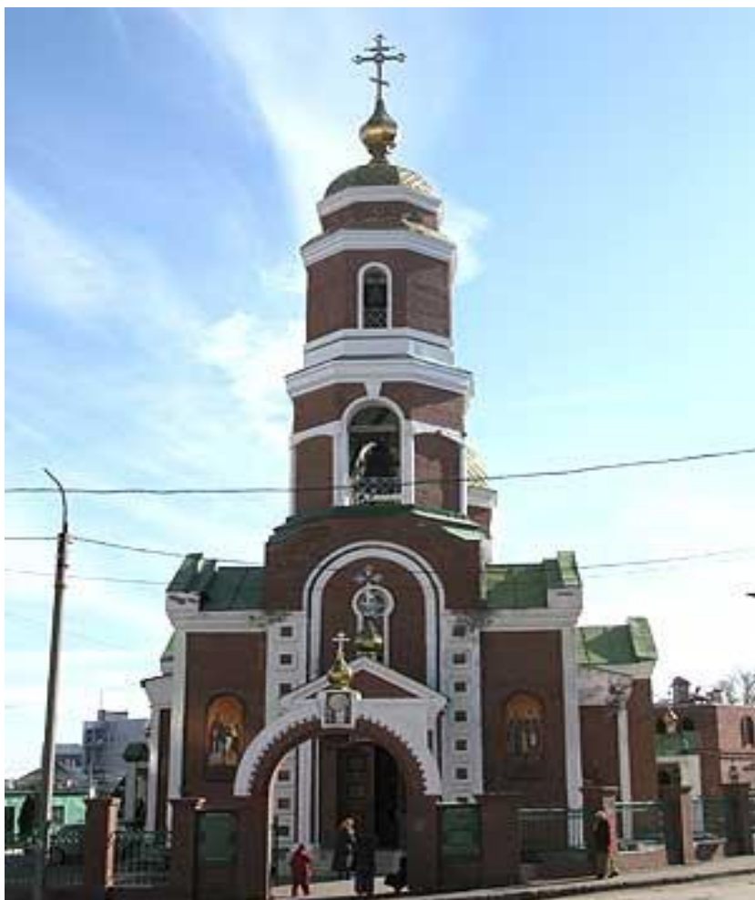
ЦЕРКОВЬ ВО ИМЯ СЕРАФИМА САРОВСКОГО