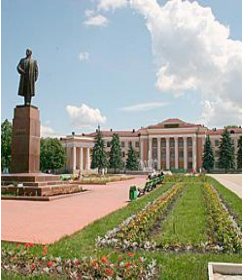
ПЛОЩАДЬ ИМ. ЛЕНИНА