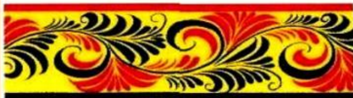
«изгибы» + «листья» и «ягоды»