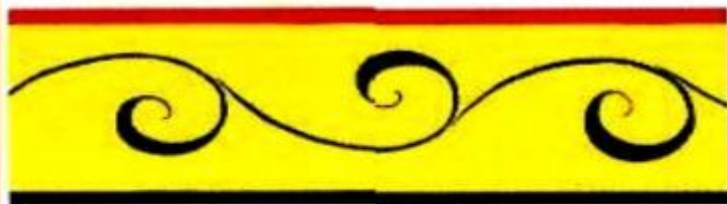
«вдувший стебель» — «изгибы»