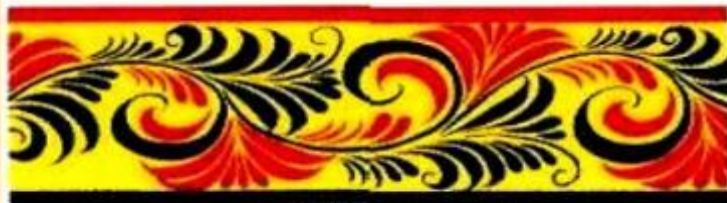
«изгибы» + «листья» и «ягоды»