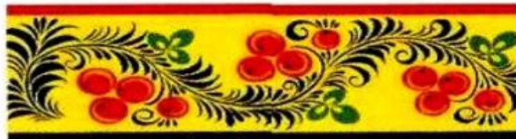
«изгибы» + «листья» и «ягоды»