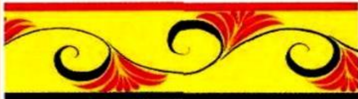
«изгибы» + «листья» и «ягоды»