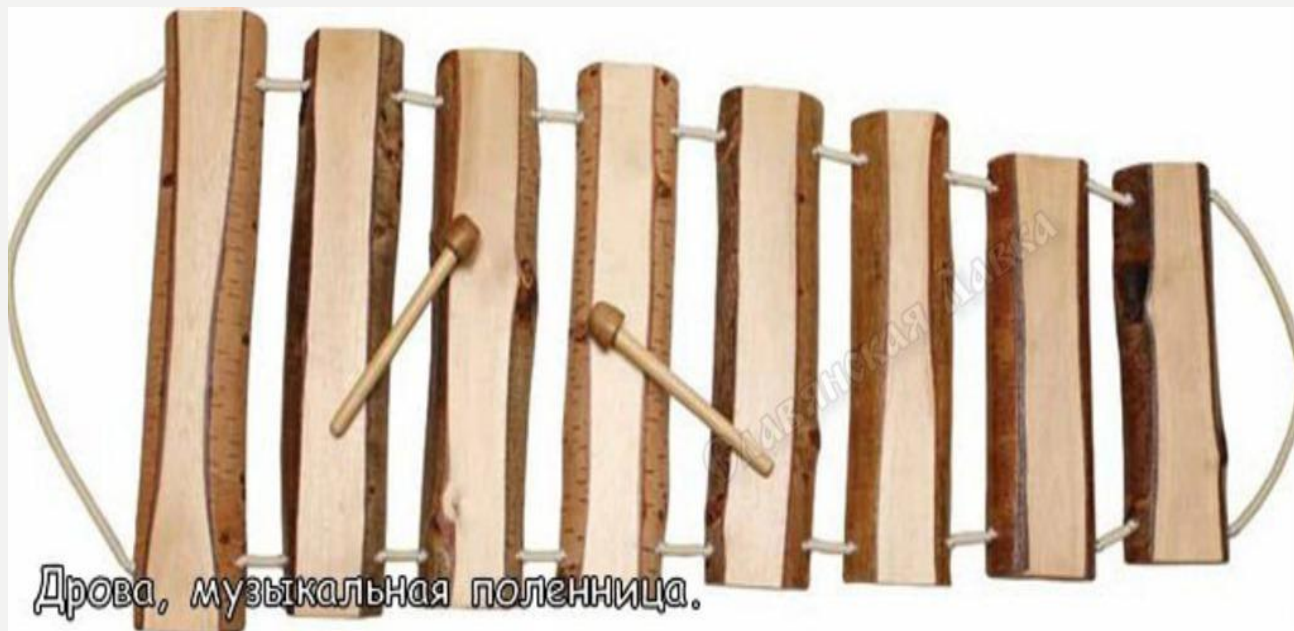
Дрова, музыкальная поленница.