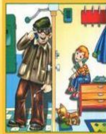
Не разговаривай и не открывай дверь незнакомым людям