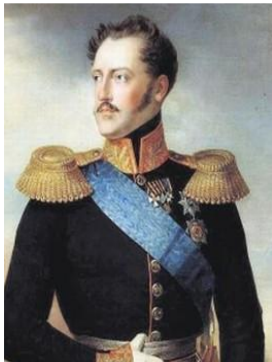
Француз Жорж Шарль Дантес