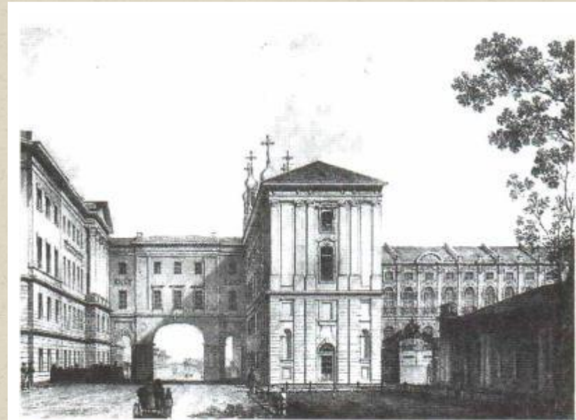
Царскосельский лицей. Литография А. Тона. 1822 г.

...Куда бы нас не бросила судьбина И счастье куда б ни повело, Всё те же мы: нам целый мир чужбина; Отечество нам Царское Село.