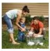
Body Parts #2 (mid-section and arms)