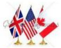
English Speaking Countries