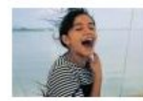
Body Parts #1 (head and face)