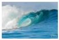
Bodies of Water