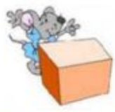
Prepositions of Place