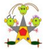
Monster's body parts