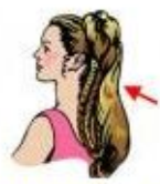
Parts of the Body