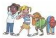
Head and Shoulders