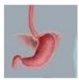
Internal Body Parts