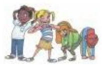
Head and Shoulders