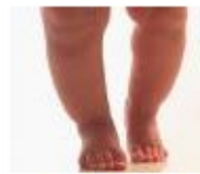
Body Parts #3 (leg)