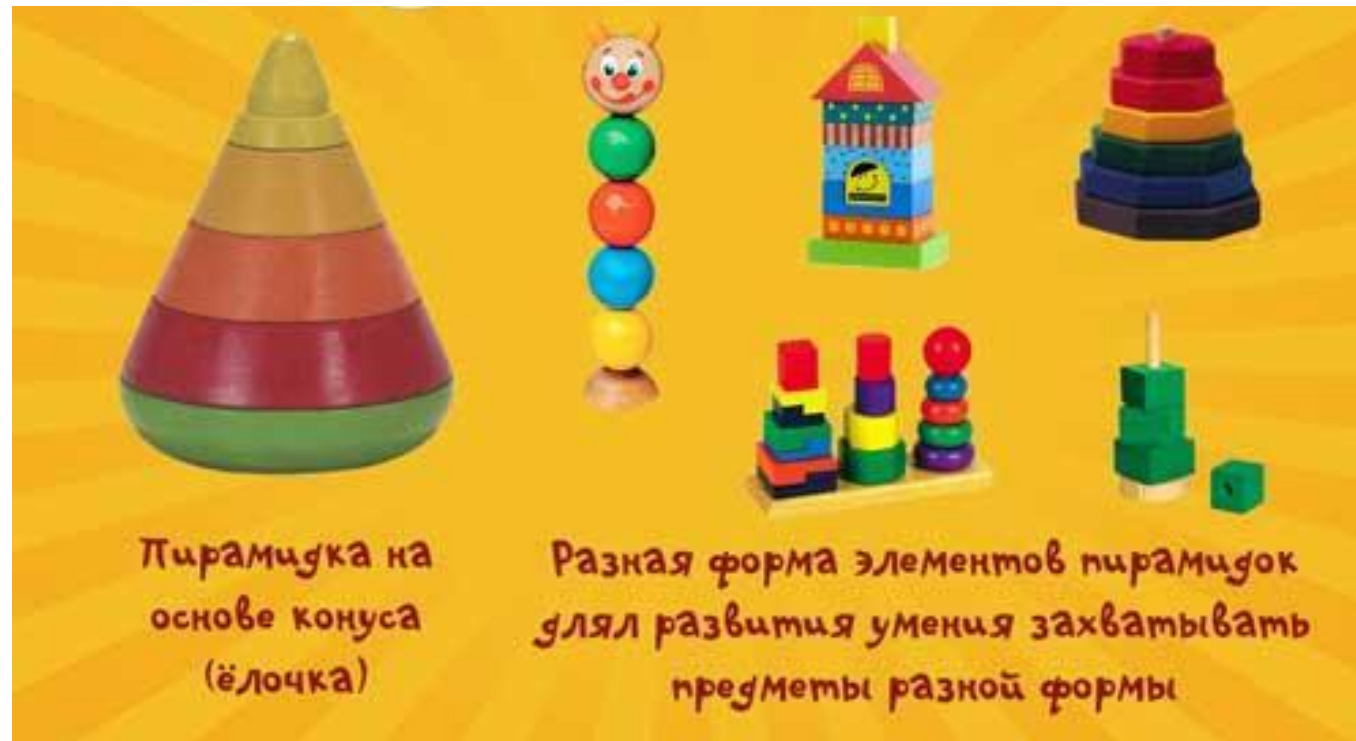
Пирамидка на основе конуса (ёлочка)

Обычно для таких игр используются деревянные пирамидки с кольцами небольшого размера (3-5 см).