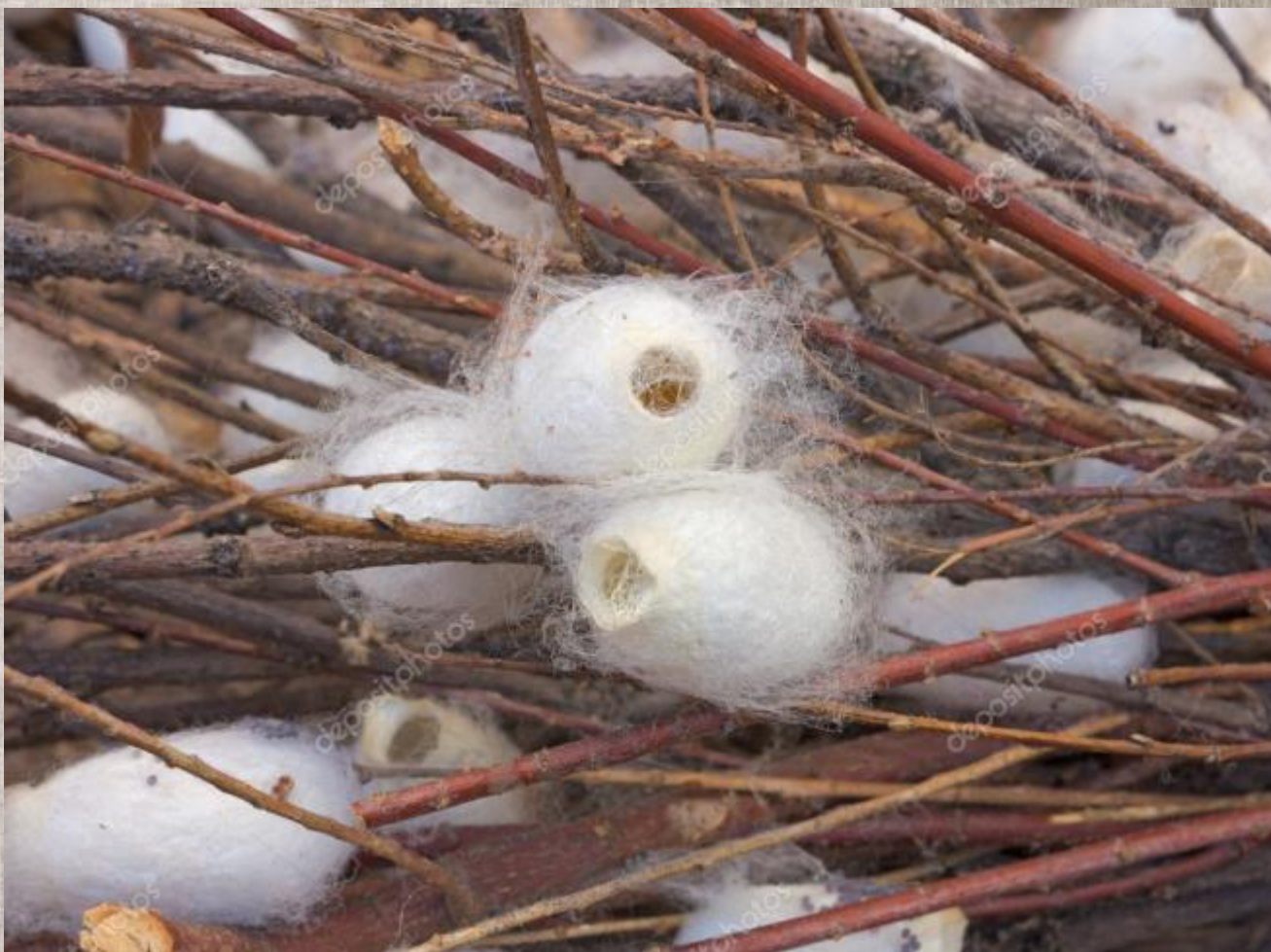
Кокон тутового шелкопряда