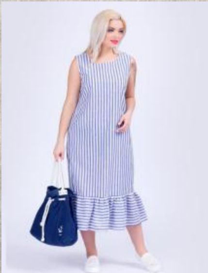
Легкая женская одежда