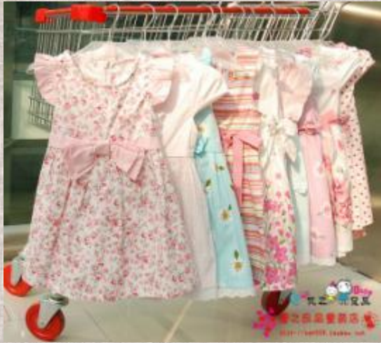
Легкая детская одежда