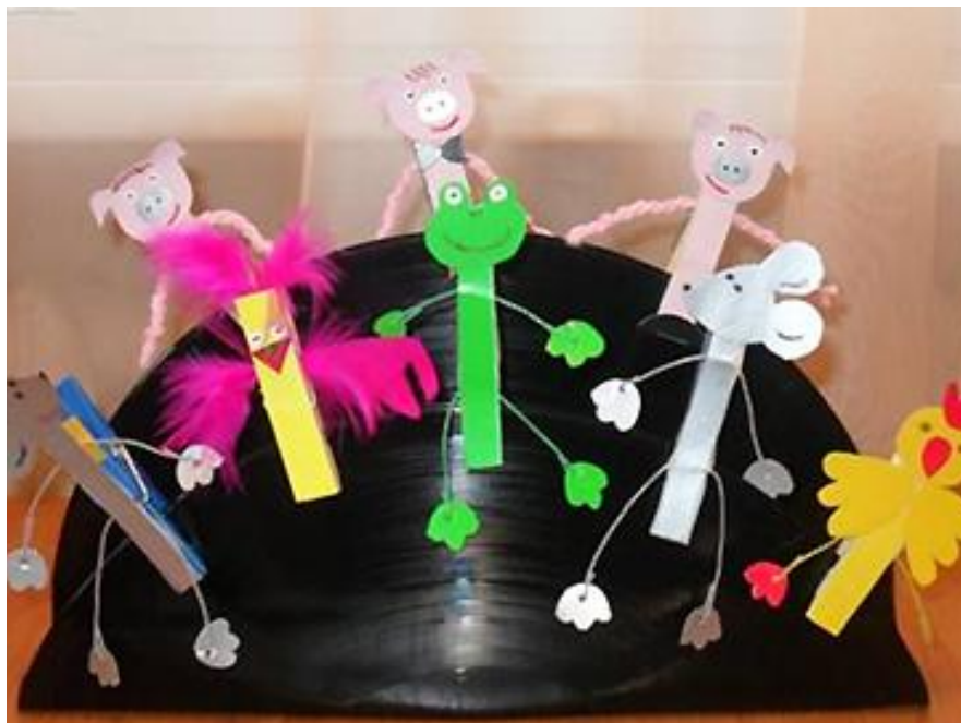
Театр на прищепках