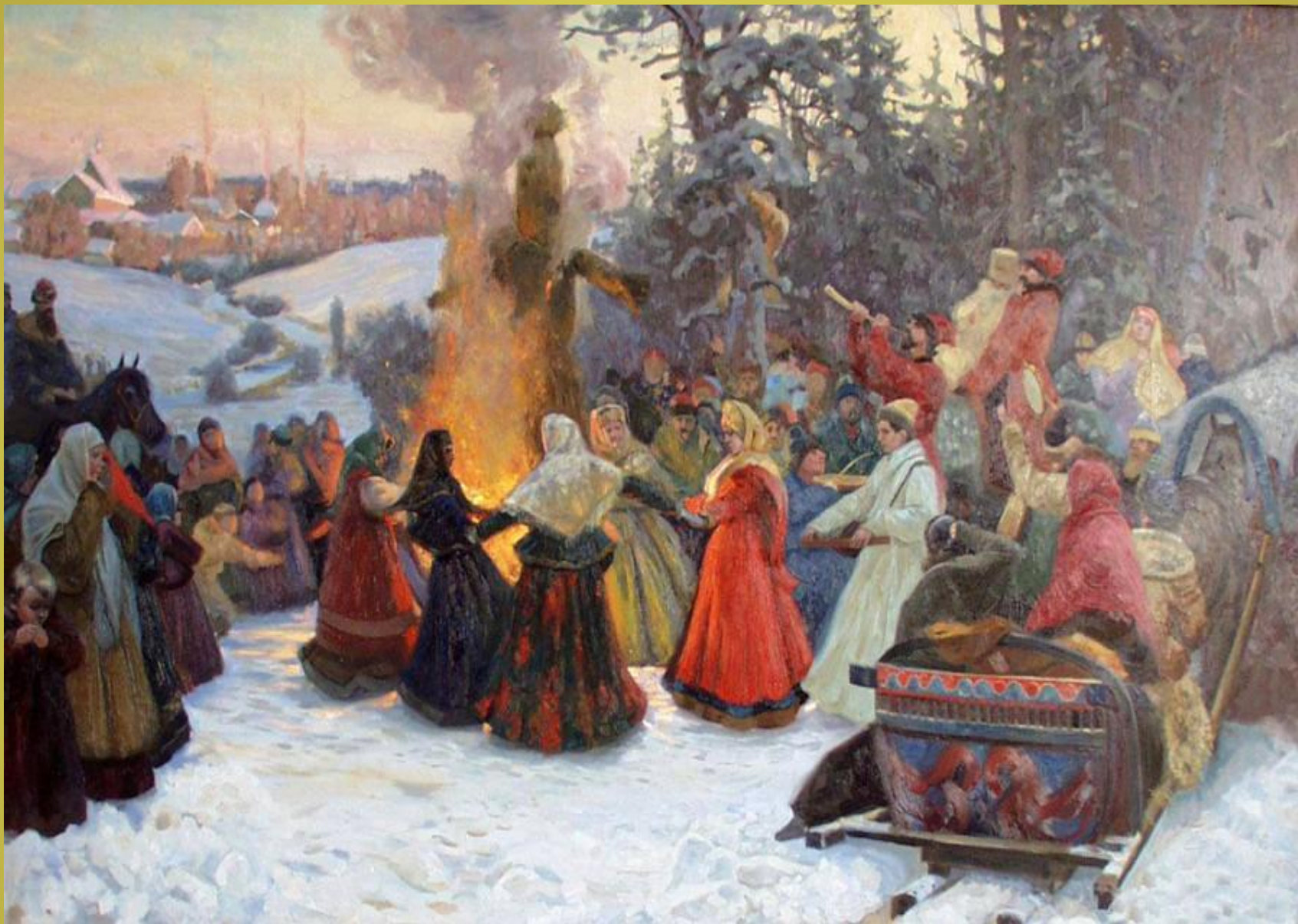
Воскресенье – проводы Масленицы.