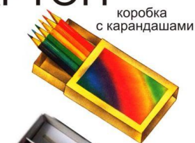
коробка с карандашами