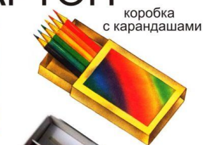
коробка с карандашами