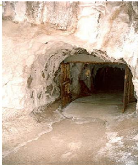
из соляных шахт