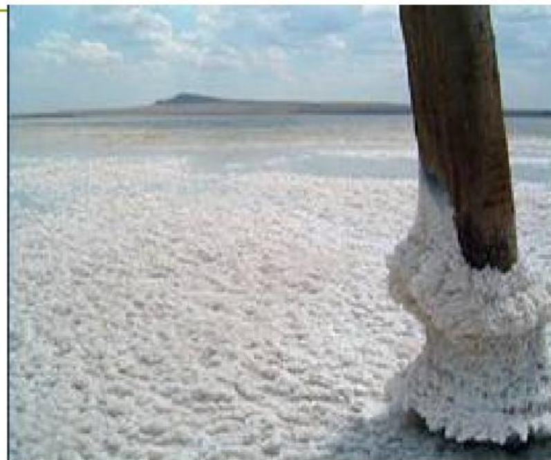
из соленых озер