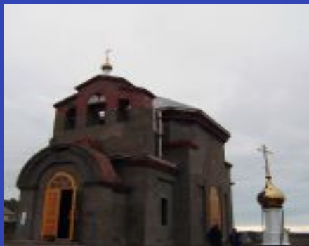
Храм св. Иннокентия Иркутского г. Ужур