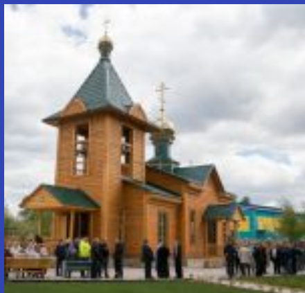
Храм Троицы Живоначальной