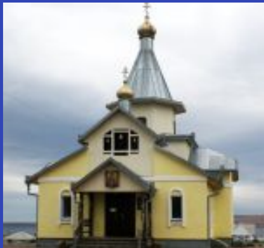
Храм Воздвижения Креста Господня С. Новоселово