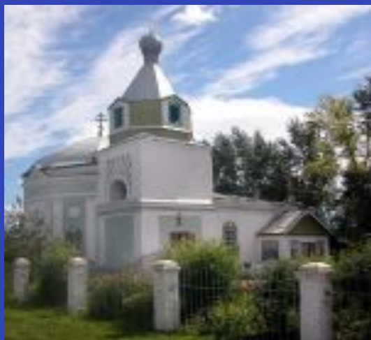
Храм Петра и Павла Г. Ужур