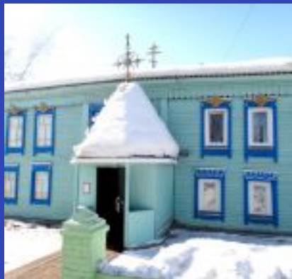
Храм Успения Пресвятой Богородицы п. Балахта