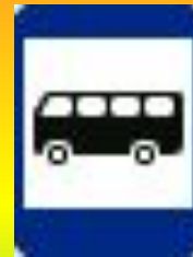
Знаки особых предписаний