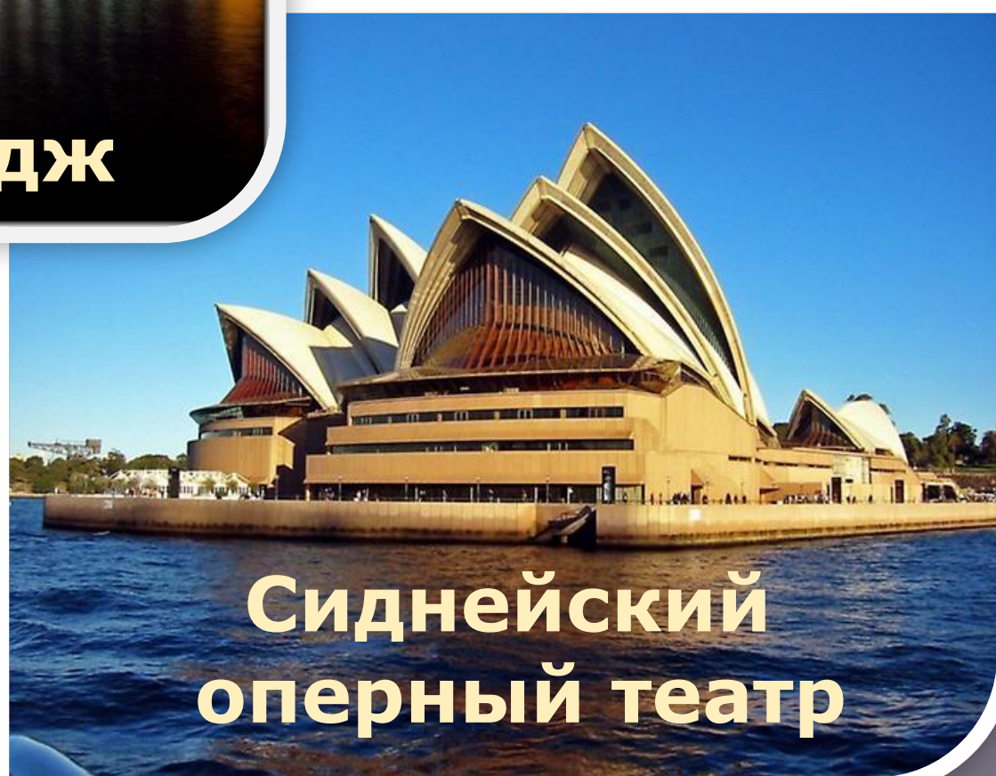
Сиднейский оперный театр