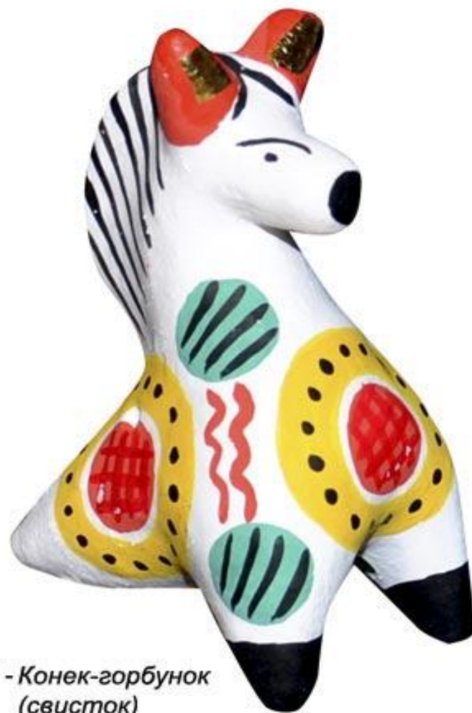
08 - Конек-горбунок (свисток)