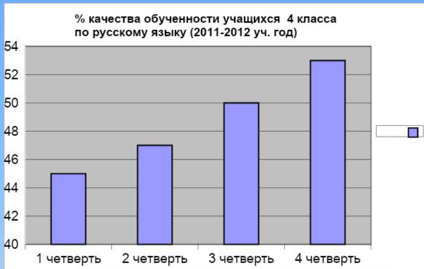
Диаграмма качества знаний учащихся за 2011-2012 уч.г.