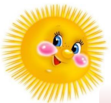
Схема создания эмоционального комфорта ребенка