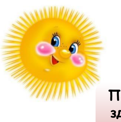
Схема создания эмоционального комфорта ребенка