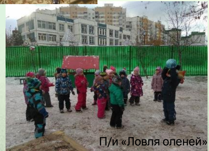
П/и «Ловля оленей»

Дагестанская народная игра «Подними игрушку»