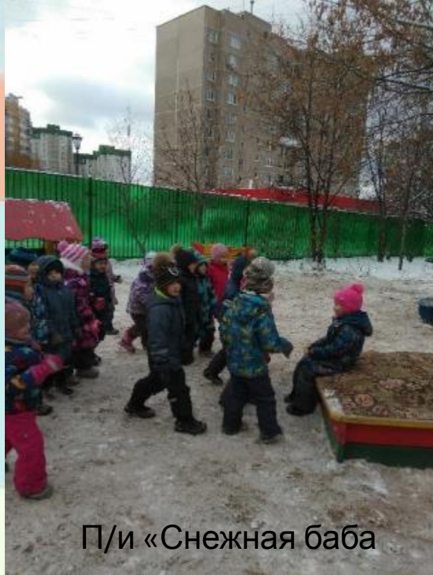
П/и «Снежная баба»