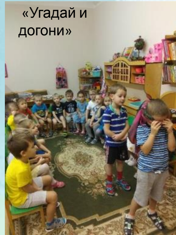
«Угадай и догони»