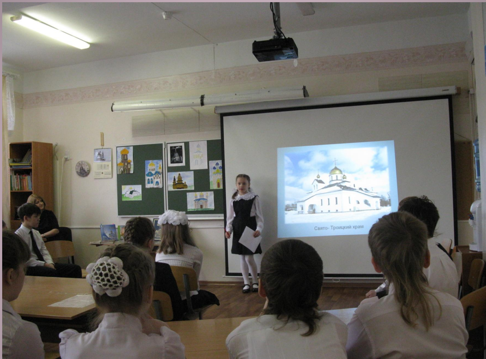
Творческая работа « Храмы Усть-Ижоры»