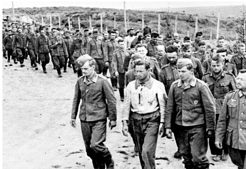
Пленные немцы. Курск, 1943-й.