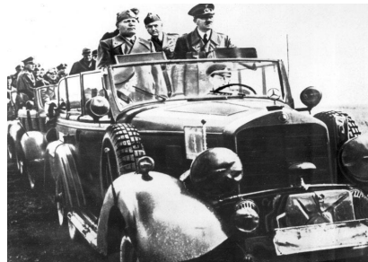
Муссолини и Гитлер в Полтаве.